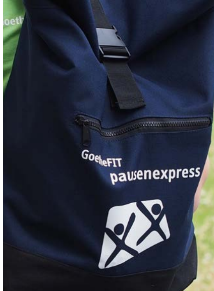
Bewegte Pause mit mobilen Kleinsportgeräten