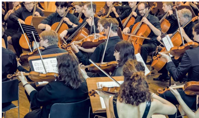
Neue Notenständer für das Collegium Musicum – mit einer Spende von 7000 Euro unterstützen Mitglieder der Freundesvereinigung die Universitätsmusiker.

Im Orchester und Chor treffen sich alle Gruppen der Universität zum gemeinsamen Musizieren – und der Kreis der Laienmusiker wächst stetig: Studie-