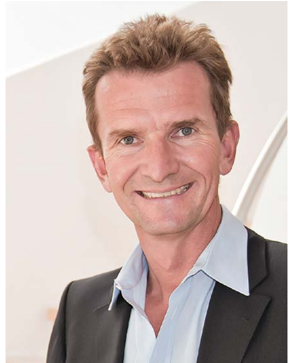
Unternehmensberater und Schwimweltmeister – Alumni-Rat Dr. Michael Groß

Heute schwimmt Michael Groß höchstens mal im Meer, während des Urlaubs. Doch das Thema Leistung ist geblieben. Es zieht sich durch sein Leben wie ein roter Faden. Leistung ist ihm ein innerer Antrieb, nach wie vor. So wundert es