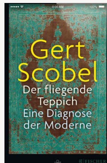
Gert Scobel DER FLIEGENDE TEPPICH – EINE DIAGNOSE DER MODERNE Fischer Taschenbuch Frankfurt am Main 2017 ISBN 978-3-596-03689-9, 368 Seiten, 16,99 €

und philosophische Mechanismen erläutert, fordert er den Leser auf, weiterzudenken, sich selbst und die Realität kritisch zu hinterfragen und zu verstehen, dass man sich auf schwankendem Grund befindet, eben auf einem fliegenden Teppich. Es geht um die Suche nach Erkenntnis. Gert Scobel studierte in Frankfurt und Berkley Philosophie und Theologie. Seit 1995 moderiert er für verschiedene TV-Sender anspruchsvolle Magazin-Formate. Bekannt wurde er mit der 3-SAT-Sendung »Kulturzeit«. Seit 2016 ist Gert Scobel zudem Professor für »Philosophie und Interdisziplinarität« an der Hochschule Bonn-Rhein-Sieg. (hjü) ■